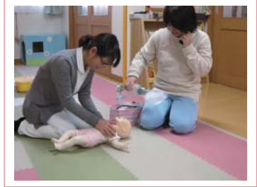
緊急時のシミュレーショントレーニング

調査結果は、実際にますかっと病児保育ルームを利用されたことがある方は47.3% (回答数 36名) でしたが、その感想を尋ねました。初めて預けるときは抵抗があっても、一度でも預けるとその抵抗感はかなり薄らぐようです。またお子様がとても病児保育ルームを気に入って下さると同時にスタッフの対応や保育にも満足度が高いようです。(図1)