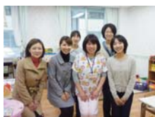
↑静岡県立総合病院様