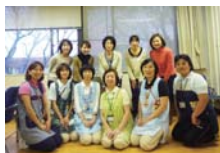
静岡県立こども病院様⇒

静岡県静岡市の静岡県立総合病院様および静岡県立こども病院様に、ますかっと病児保育ルーム副室長、小児科医師1名、ますかっと病児保育ルームの保育士3名(病児保育ルーム担当1名、病棟保育担当2名)が見学に伺いました。HPSの方や保育士の方々からプレパレーションやディストラクションの様子の見学、入院中の子どもやご家族に対する接し方などについて教わりました。