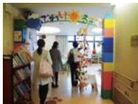
↑広々としたプレイルーム