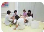
小児科医による勉強会

ますかっと病児保育ルームは平成21年10月に開所し、年間の利用者数も徐々に増え、本年度は500名以上の方にご利用頂きました。皆様の大切なお子様を安心してお預け頂けるよう、ますかっと病児保育ルームでは緊急時のシミュレーショントレーニングや多職種がそれぞれの立場で行う症例検討、学外病児保育施設の見学、学会発表や情報収集など、スタッフ教育にも力を入れております。