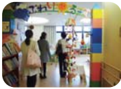
他施設の見学・情報交換