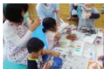
西2階プレイルームの様子