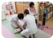
急変時シミュレーショントレーニング