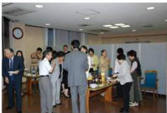
情報交換会の様子