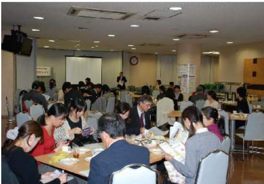
軽食をとりながらフリートーキング