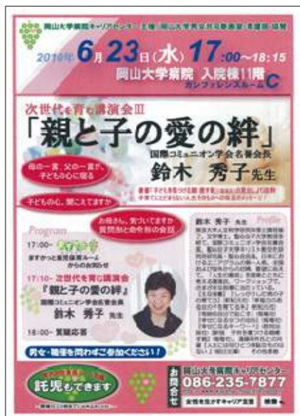
次世代を育む講演会Ⅲ 平成 22 年 6 月 23 日