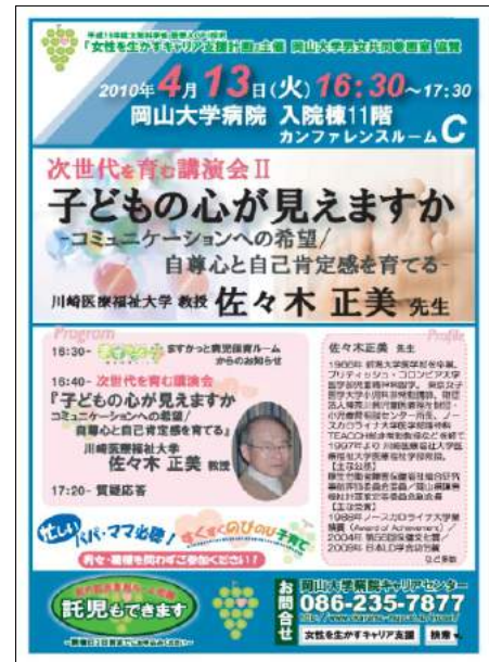
次世代を育む講演会Ⅱ 平成 22 年 4 月 13 日