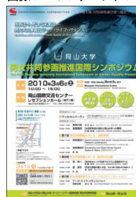
国際シンポジウムチラシ