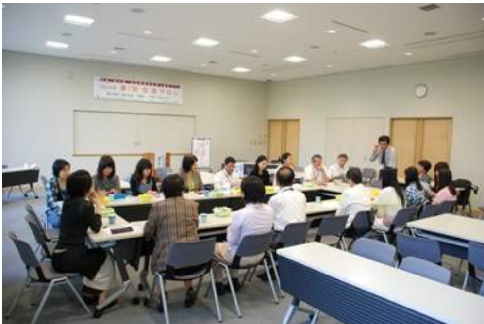
フリートーキングの一場面