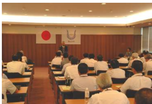
千葉 喬三学長による挨拶