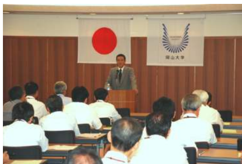
折原 守氏 独立行政法人国立科学博物館理事