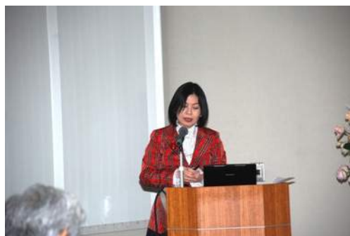
美馬のゆり氏（公立はこだて未来大学 情報アーキテクチャ学科 教授）

「学習とは個人が共同体に参加する過程である」という参加型の学習メタファーに立つ時、学習環境のデザインおよびそのプロセスはこれから話すようにこれまでとは異なるものとなるが、この考え方は女性研究者が活躍する組織作りにおいても応用できる。