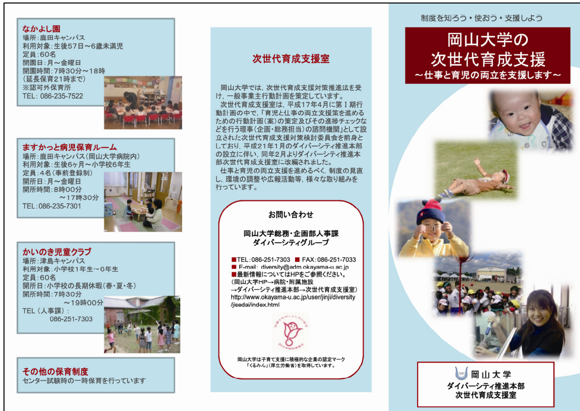
制度紹介パンフレット (表面)