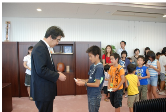
▲学長との名刺交換