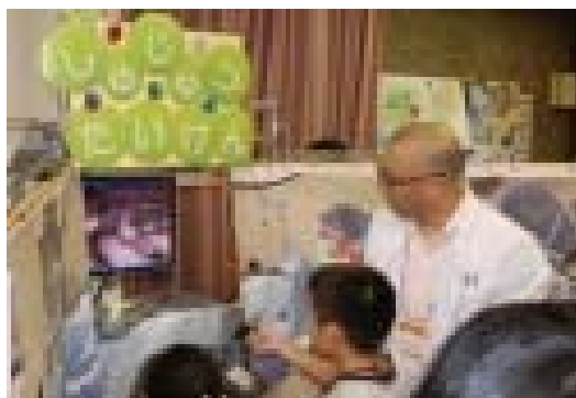
▲職業体験セミナー